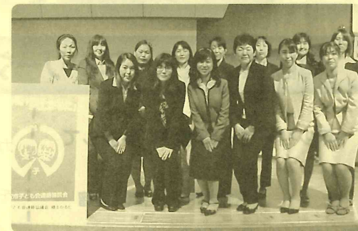
総会にて新役員承認