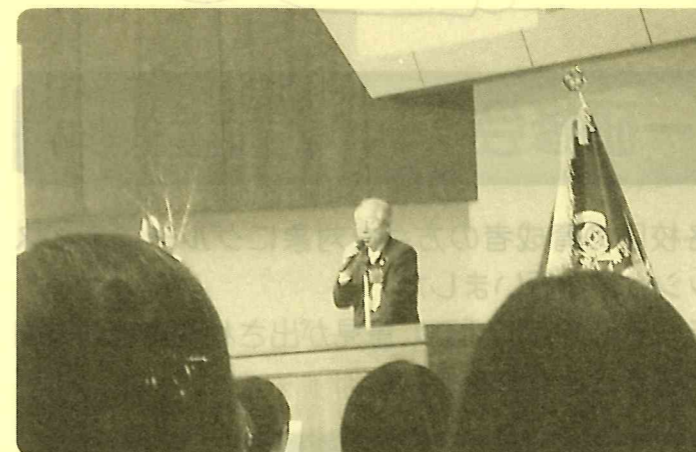
稲沢市長 あいさつ