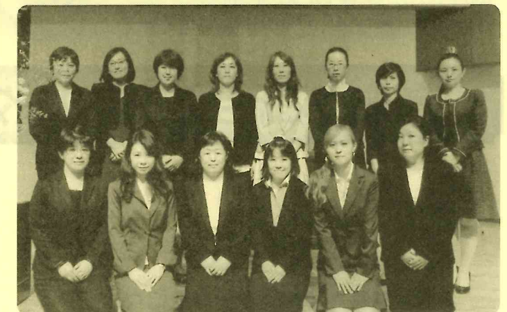
総会にて新役員承認