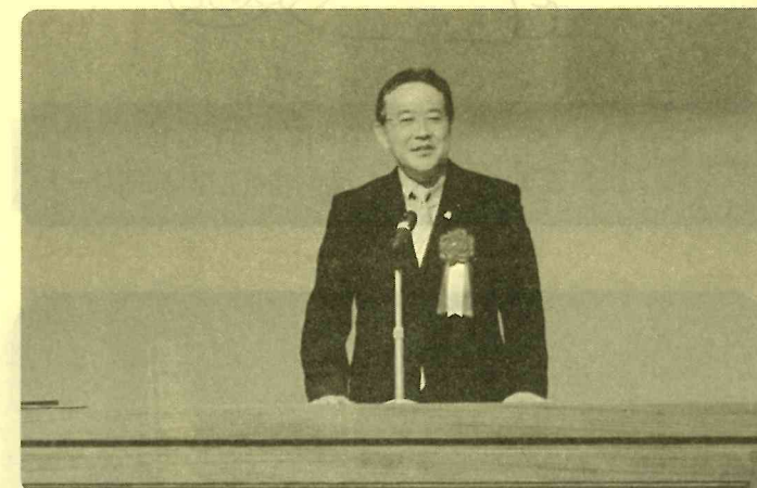
愛知県議会議員 あいさつ