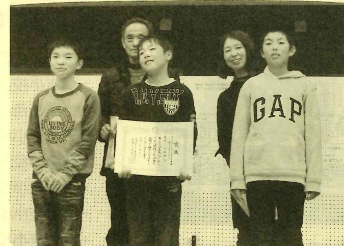
優勝おめでとうございます。